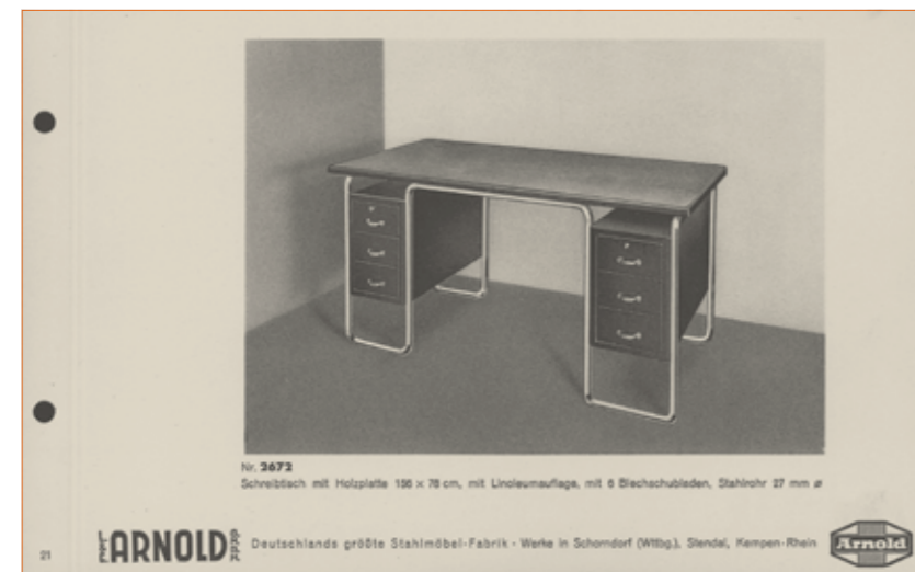
No. 2672 Schreibtisch mit Holzplatte 138 x 78 cm, mit Linoleumauflage, mit 6 Blechschubladen, Stahlrohr 27 mm ø

contor Drehstühle und Hocker Design G. Trost und H. Pflueg, 1992.