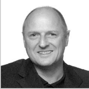
Design: Per Aagaard Jepsen