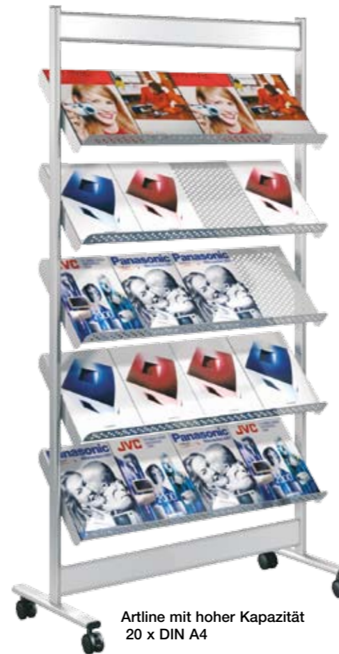
Artline mit hoher Kapazität 20 x DIN A4