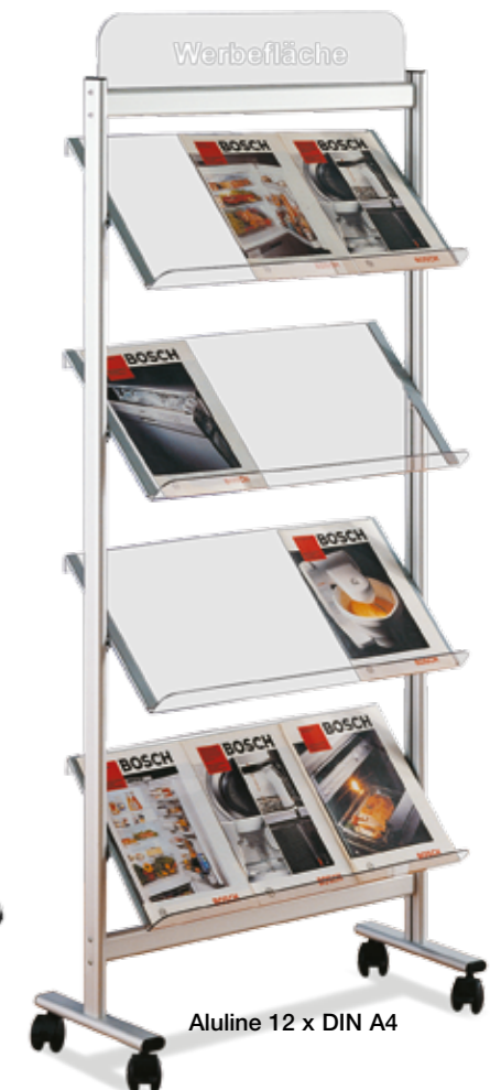
Aluline 12 x DIN A4