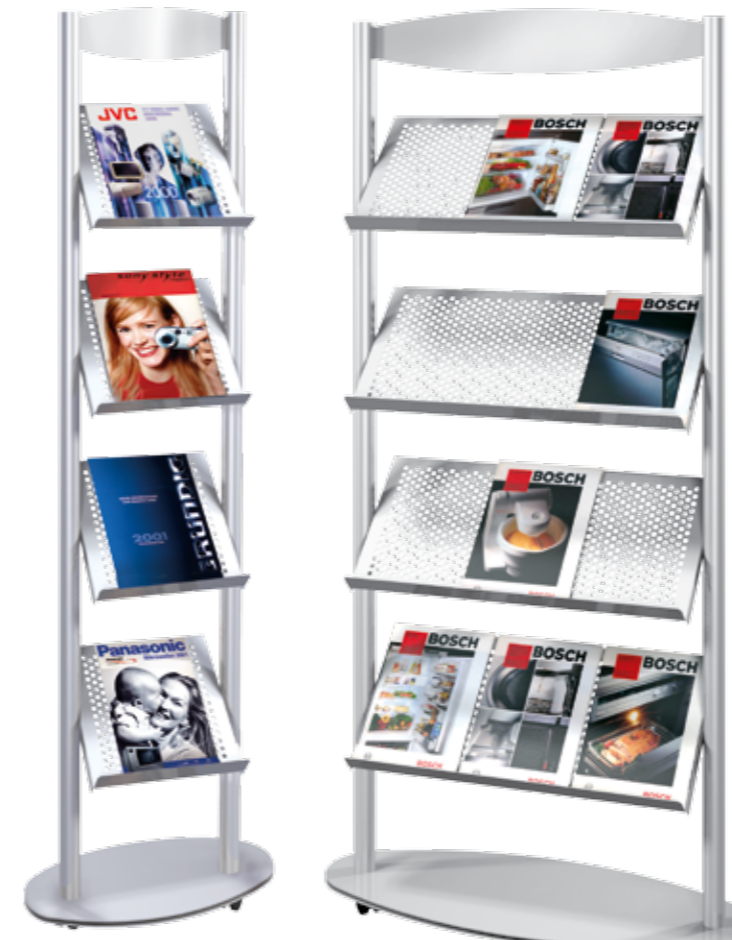
Sirius 4 x DIN A4