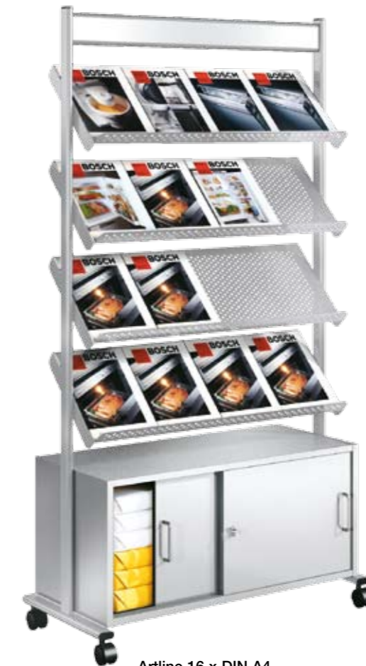
Artline 16 x DIN A4 mit Schrank