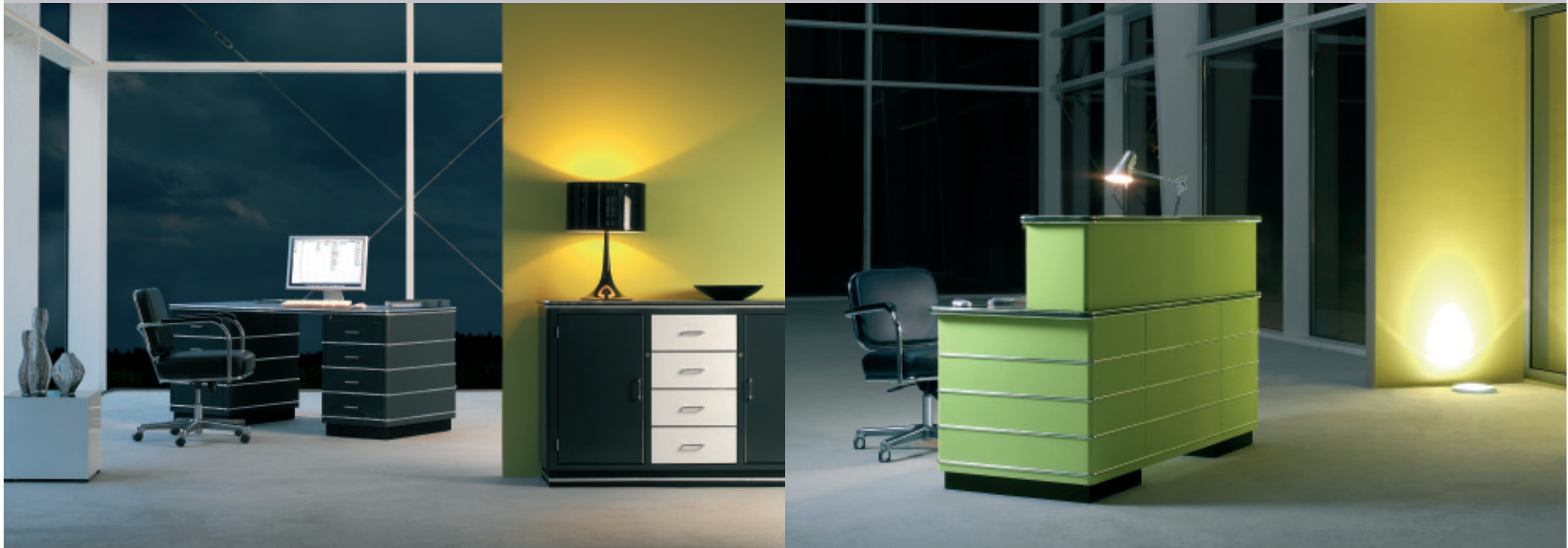
Beisteller Elements Q 44 h: 42_ b: 43_ t: 43 (cm)

The most important tool in our manufactory: hands. All our furniture is impeccably worked, down to the finest detail. We produce by hand, using traditional methods. 1-3 mm steel sheeting is cut, pressed, stamped and welded by hand, piece by piece. We remove welding seams and unevenness manually. Finally, paint is applied – using acrylics developed in the automotive industry. This gives the surfaces a high gloss, and at the same time makes them hard-wearing and easy to care for. The colour palette, in all the RAL tones, allows our furniture to be matched with the widest possible range of spaces. The result of this painstaking manufacture is authentic pieces in consistently high quality, handmade in Germany. Inimitable, unique. Identified by our badge, which marks out every single piece.