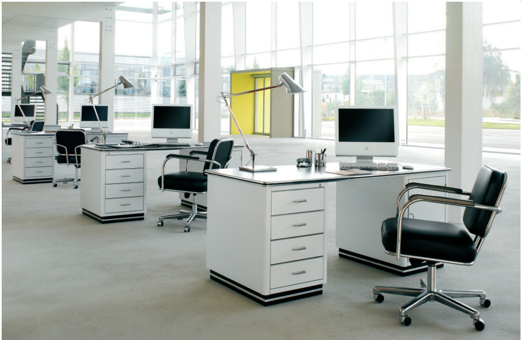
Schreibtisch TB 228 h: 77_ b: 175_ t: 80 (cm)