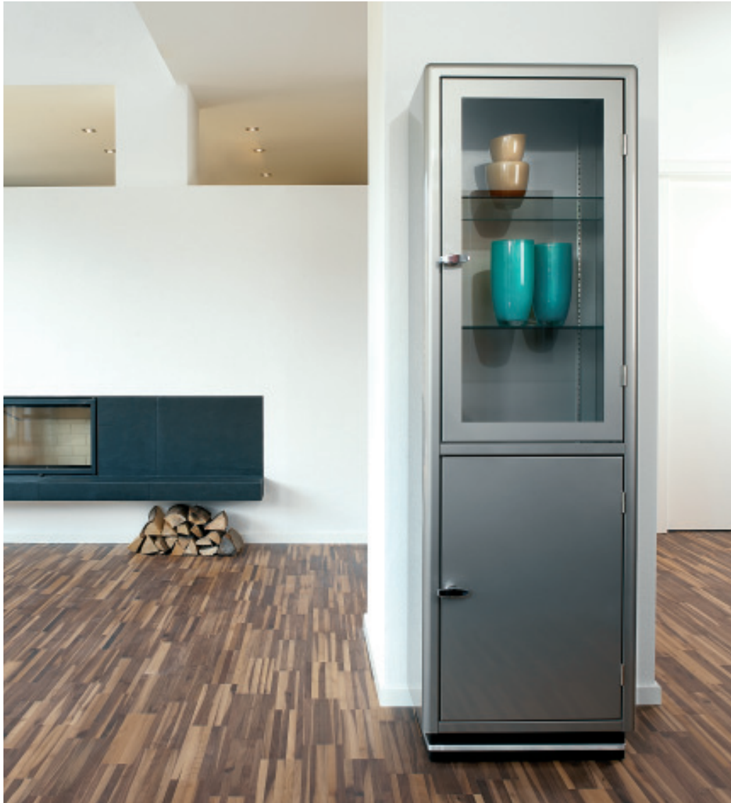
Glasvitrine SB 422 h: 180_ b: 55_ t: 38 (cm)