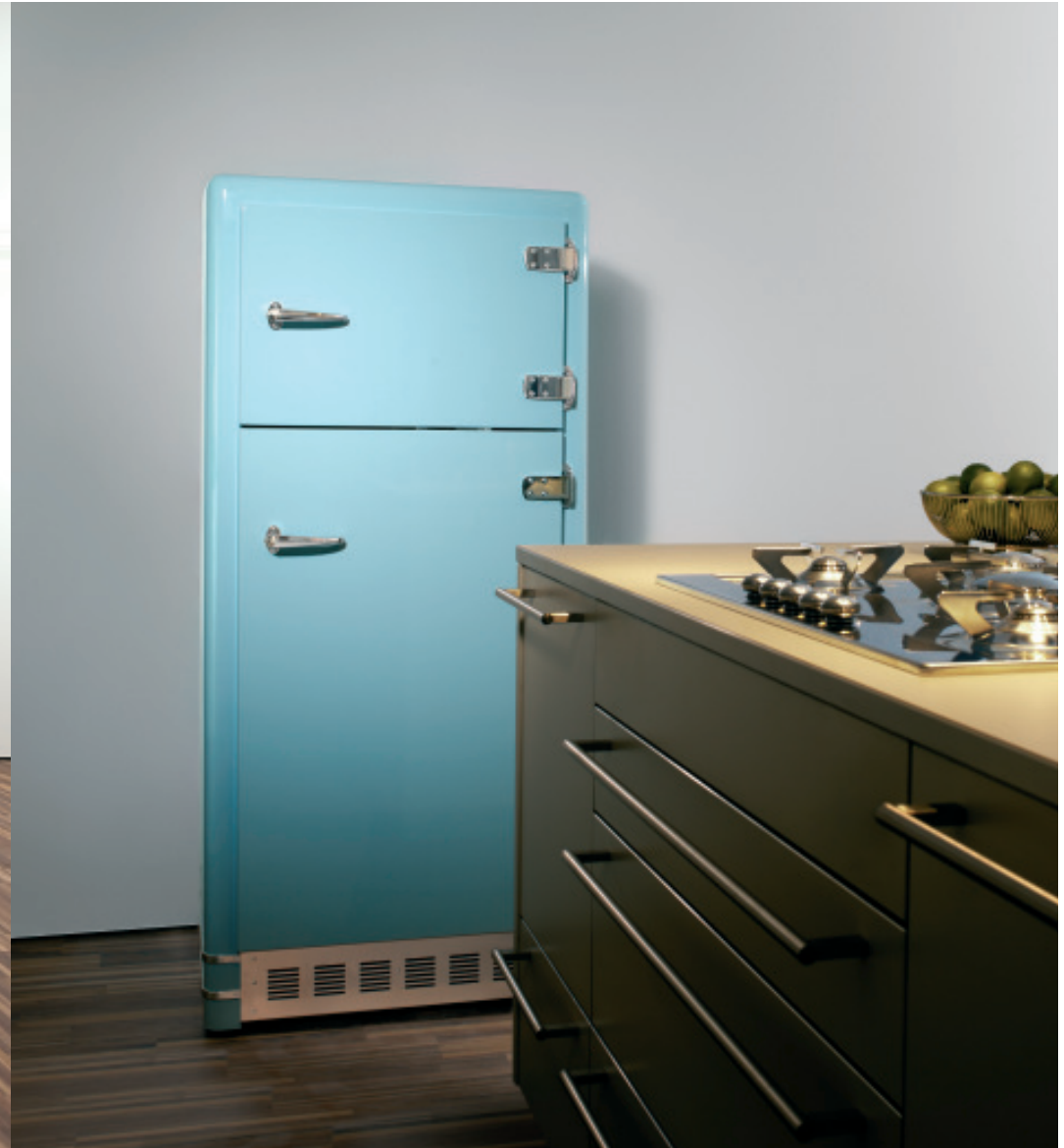
Kühlschrank CR 3-1 h: 154_ b: 70_ t: 68 (cm)