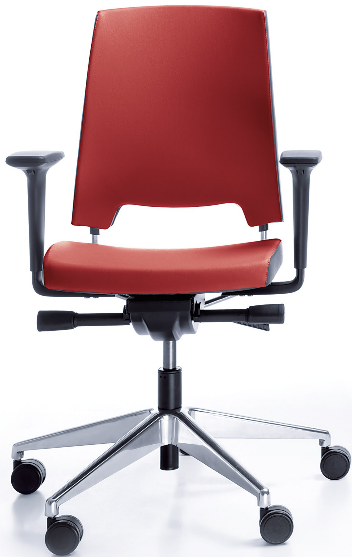
ARCA 21SL CHROME P51PU