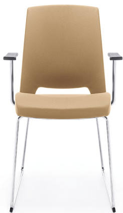
ARCA 21V CHROME PP