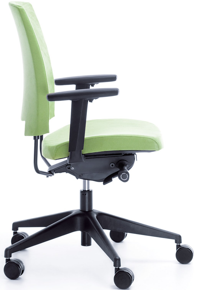
ARCA 21SL BLACK P54PU