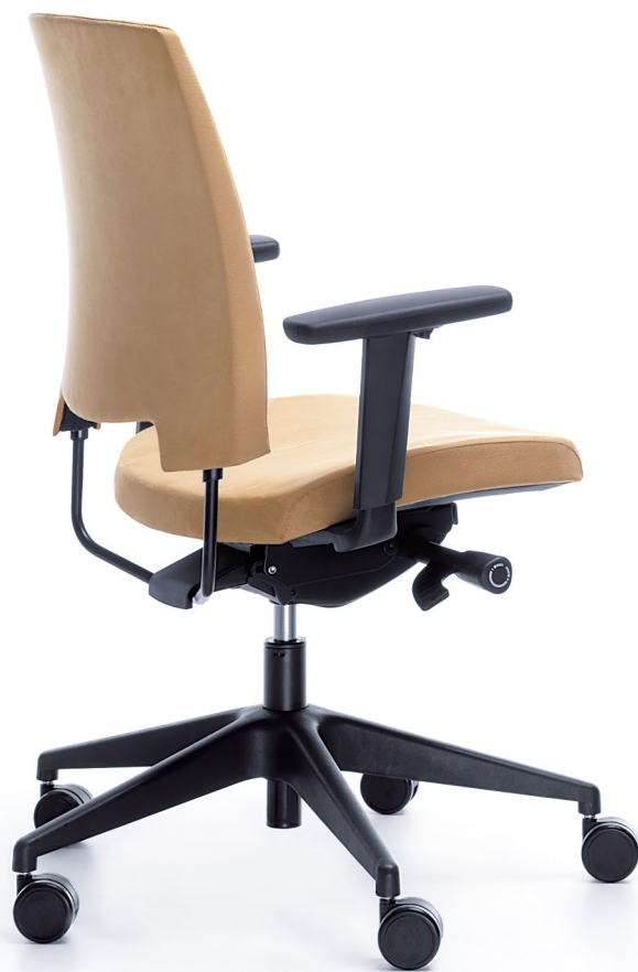
ARCA 21SL BLACK P54PU