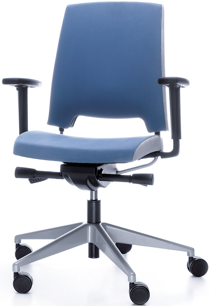
ARCA 21SL METALLIC P54PU