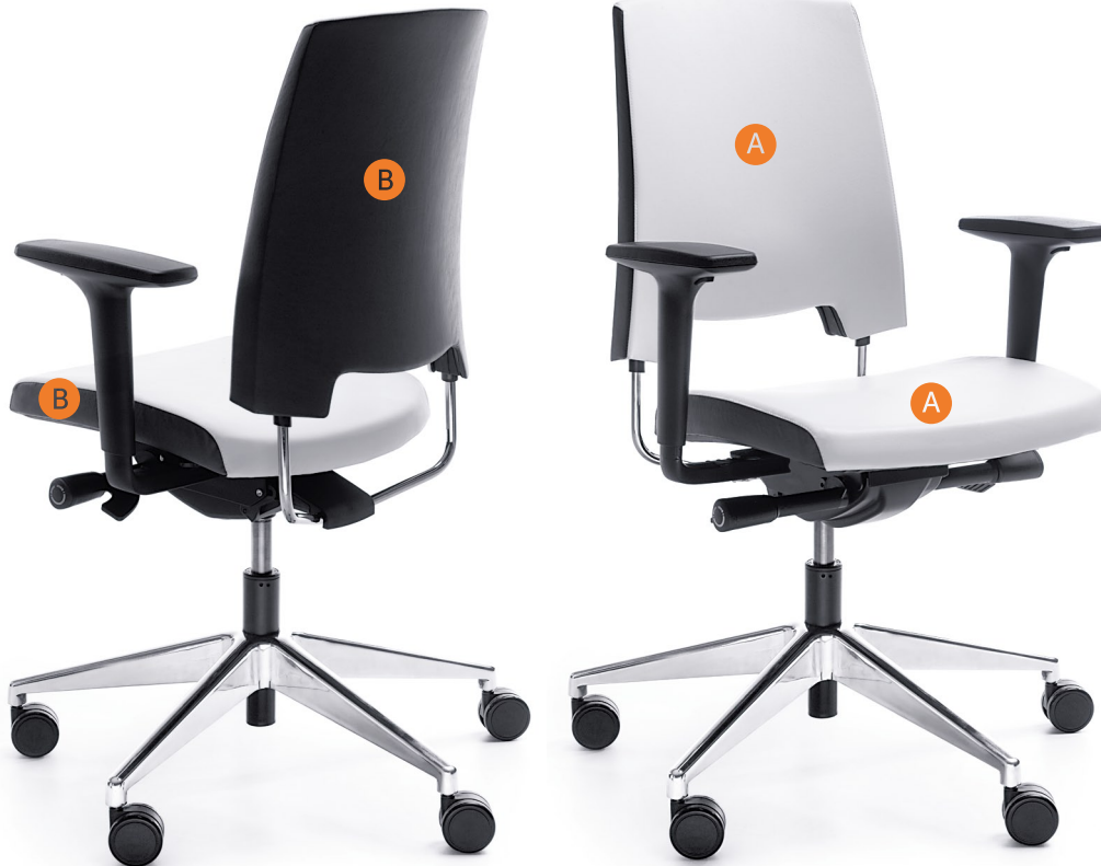
ARCA 21SL CHROME P51PU