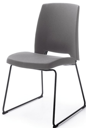
ARCA 21V BLACK