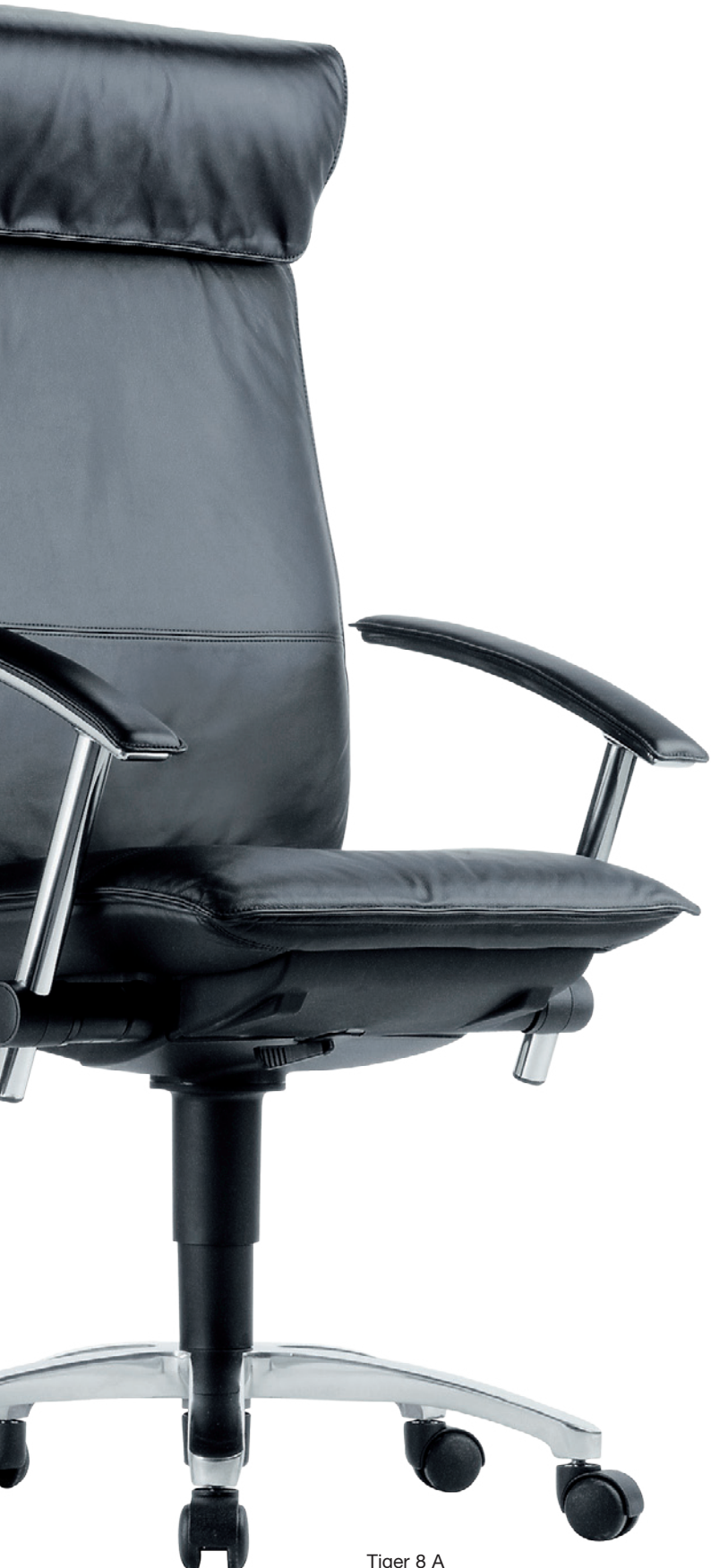
Tiger 8 A