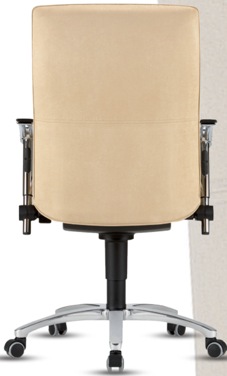
Tiger 6 HA