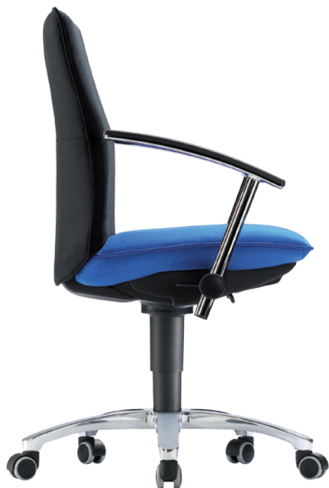
Tiger 4 A