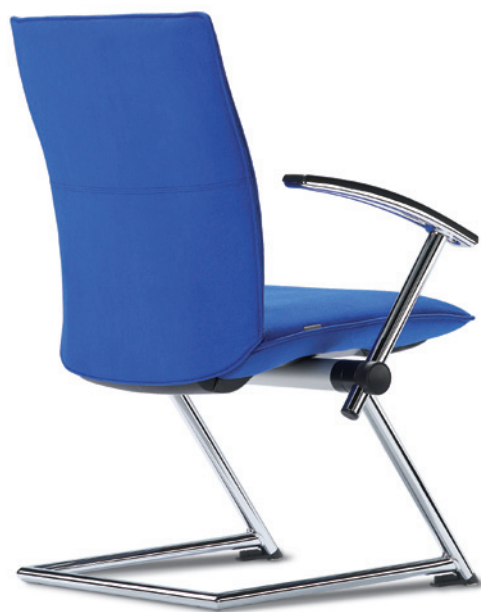
Tiger 5 A

EN Tiger. Active seating in optimum form.