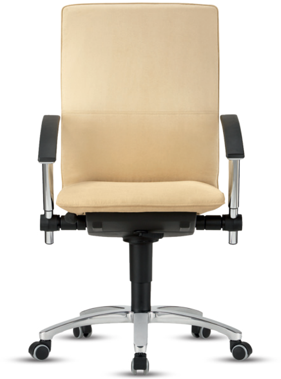
Tiger 6 HA