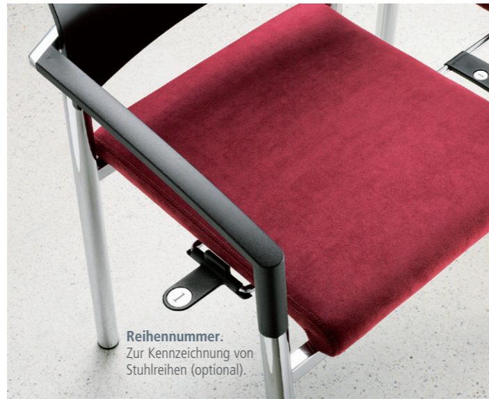
Reihennummer. Zur Kennzeichnung von Stuhlreihen (optional).