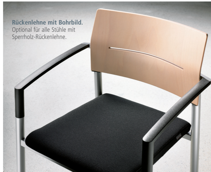
Rückenlehne mit Bohrbild. Optional für alle Stühle mit Sperrholz-Rückenlehne.