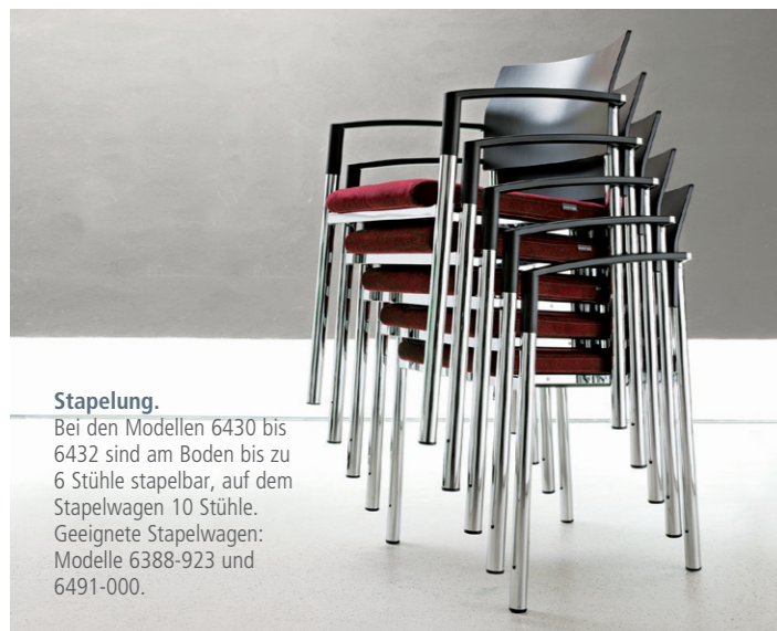
Stapelung. Bei den Modellen 6430 bis 6432 sind am Boden bis zu 6 Stühle stapelbar, auf dem Stapelwagen 10 Stühle. Geeignete Stapelwagen: Modelle 6388-923 und 6491-000.