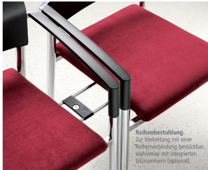
Reihenbestuhlung. Zur Verkettung mit einer Reihenverbindung bestückbar, wahlweise mit integrierten Sitznummern (optional).