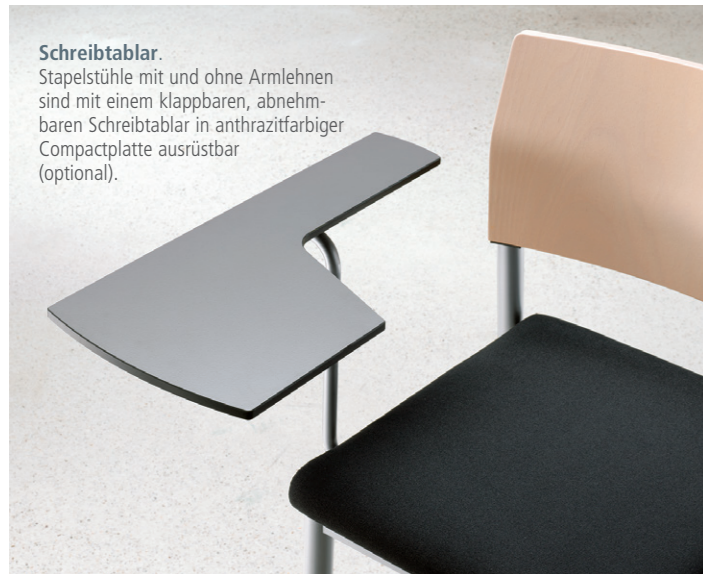
Schreibtablar. Stapelstühle mit und ohne Armlehnen sind mit einem klappbaren, abnehmbaren Schreibtablar in anthrazitfarbiger Compactplatte ausrüstbar (optional).