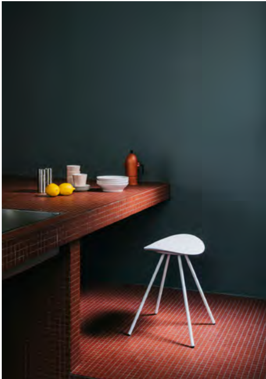
Coma 4L (ref. 2096) in monochrome RAL 9016.