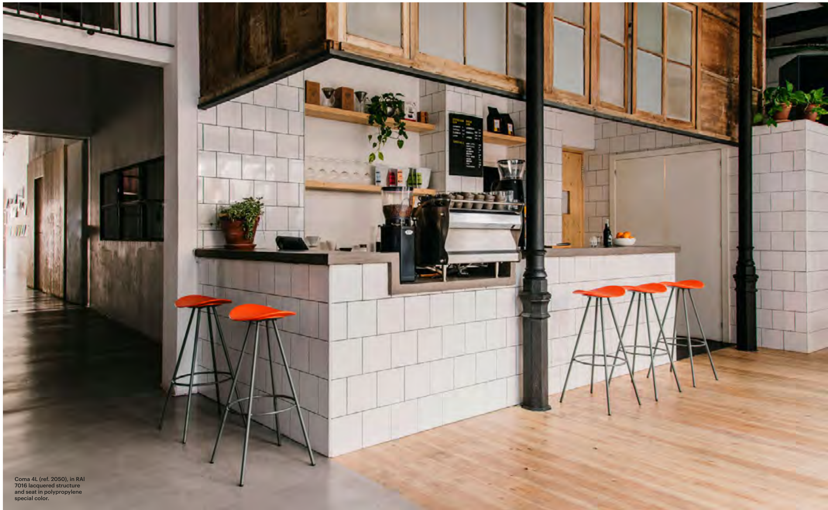
Coma 4L (ref. 2050), in RAI 7016 lacquered structure and seat in polypropylene special color.