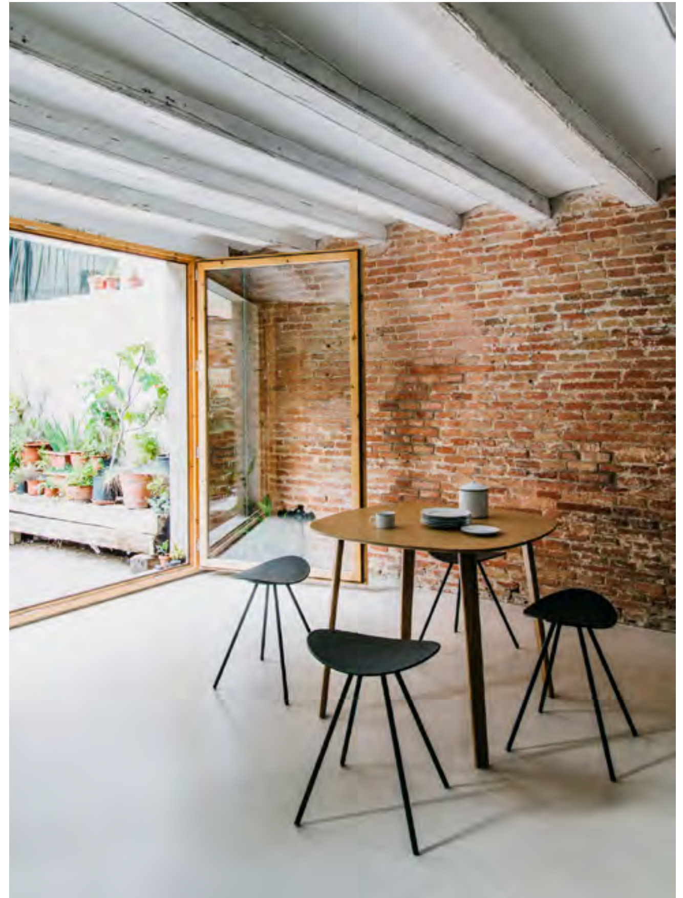
On the right: Coma 4L (ref. 2096) in monochrome RAL 9005 with LTS System table (ref. 4974) in oak.