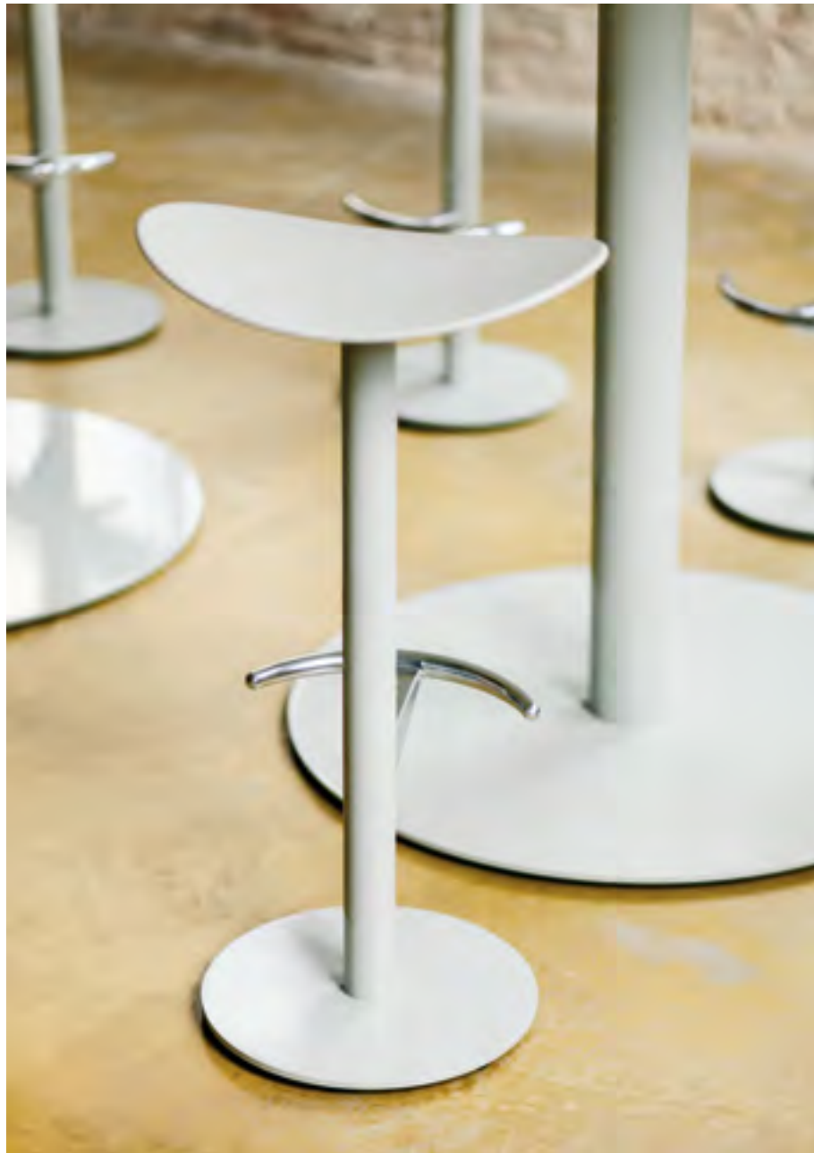
Coma stools (ref. 2000) in RAL 7032 monochrome.