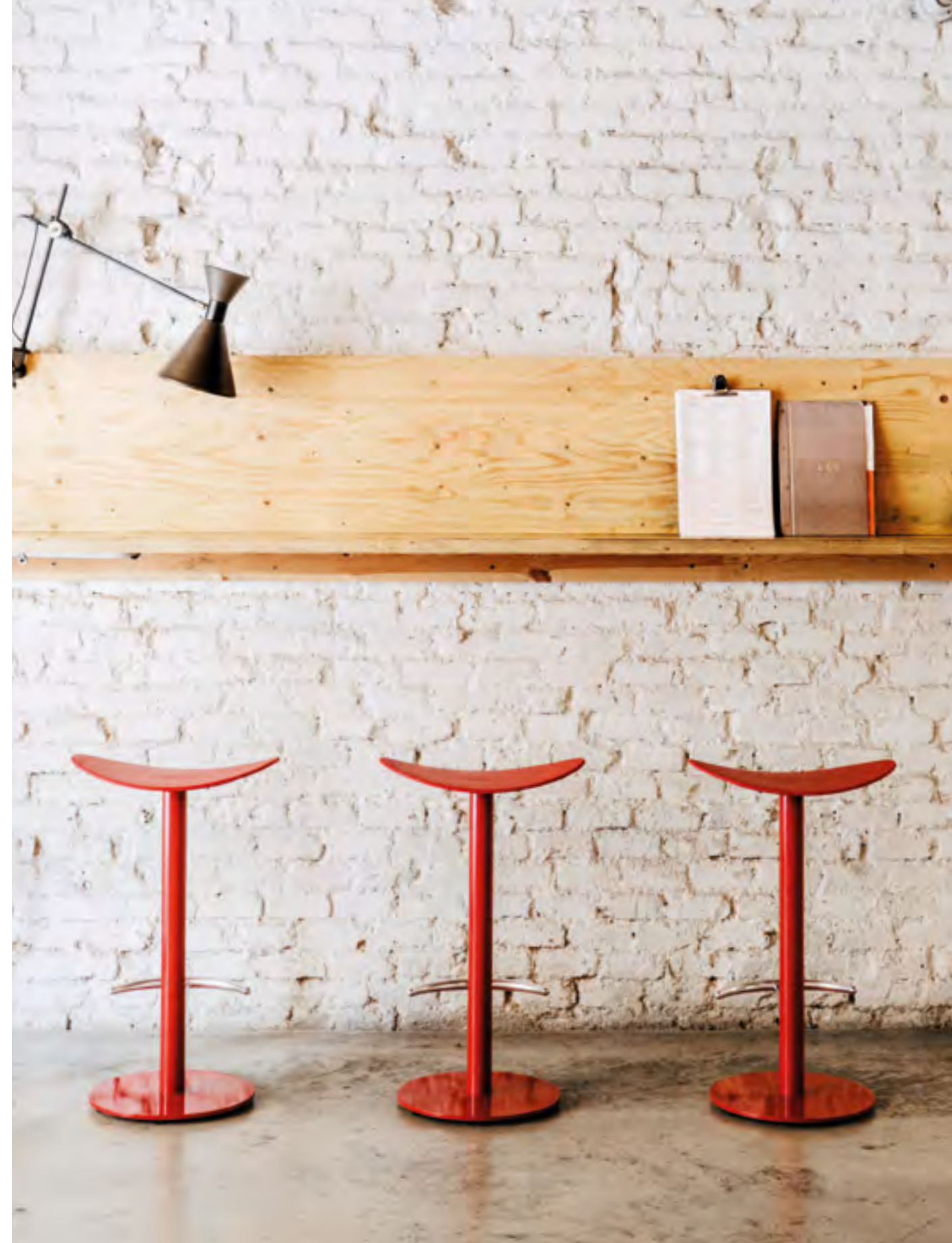
On the right: Coma stool (ref. 2004) in Pantone 4975C monochrome.