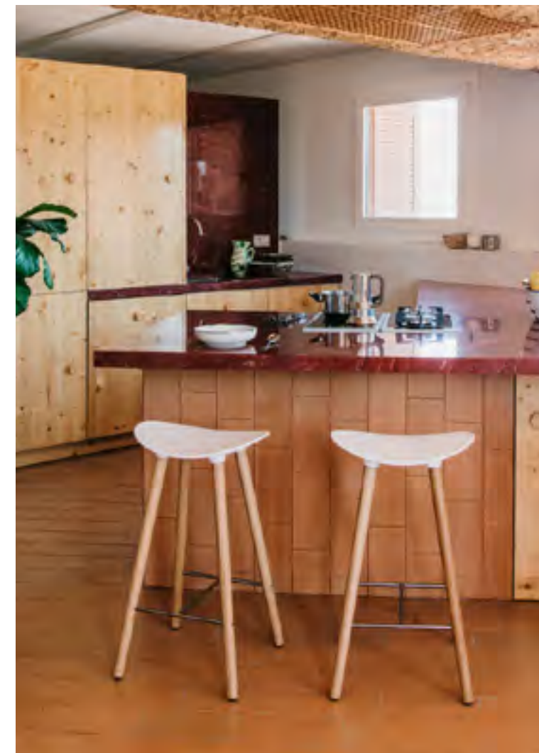
Coma Wood (ref. 2095), in oak legs and upholstered in Hallingdal 596 and 526 with LTS System (ref. 4972).

Las opciones de tapicería ofrecen una sensación más cálida, sin renunciar al minimalismo de Coma.