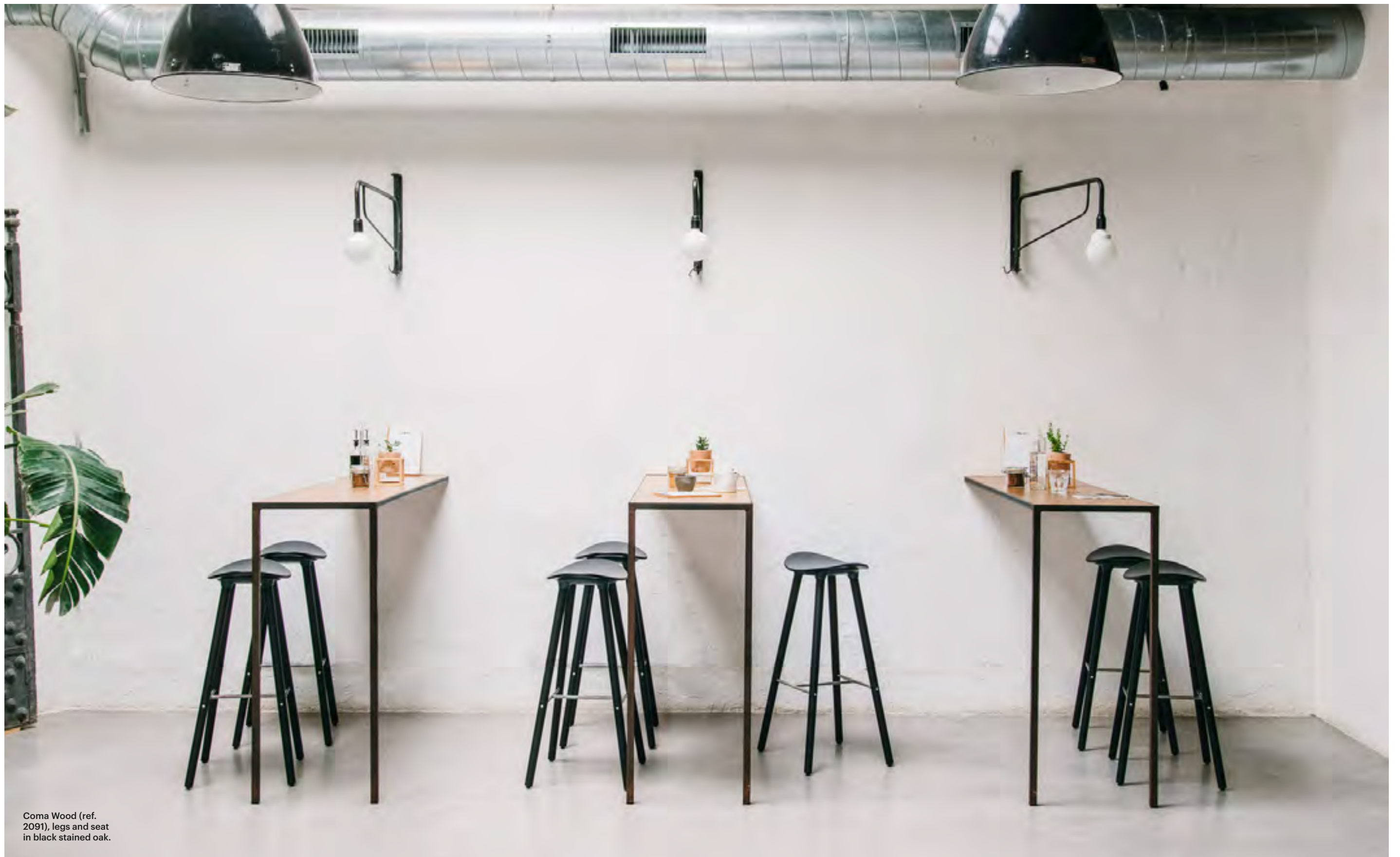
Coma Wood (ref. 2091), legs and seat in black stained oak.