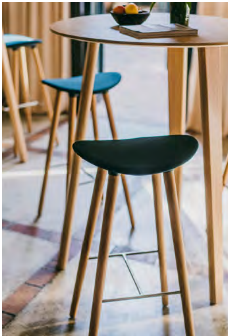
Coma wood stool (ref. 2091) with oak legs and seat upholstered in Steep Melange 68158. High table LTS System (ref. 4977), in oak.

Coma Wood transmite elegancia y calidad con una sólida ingeniería.