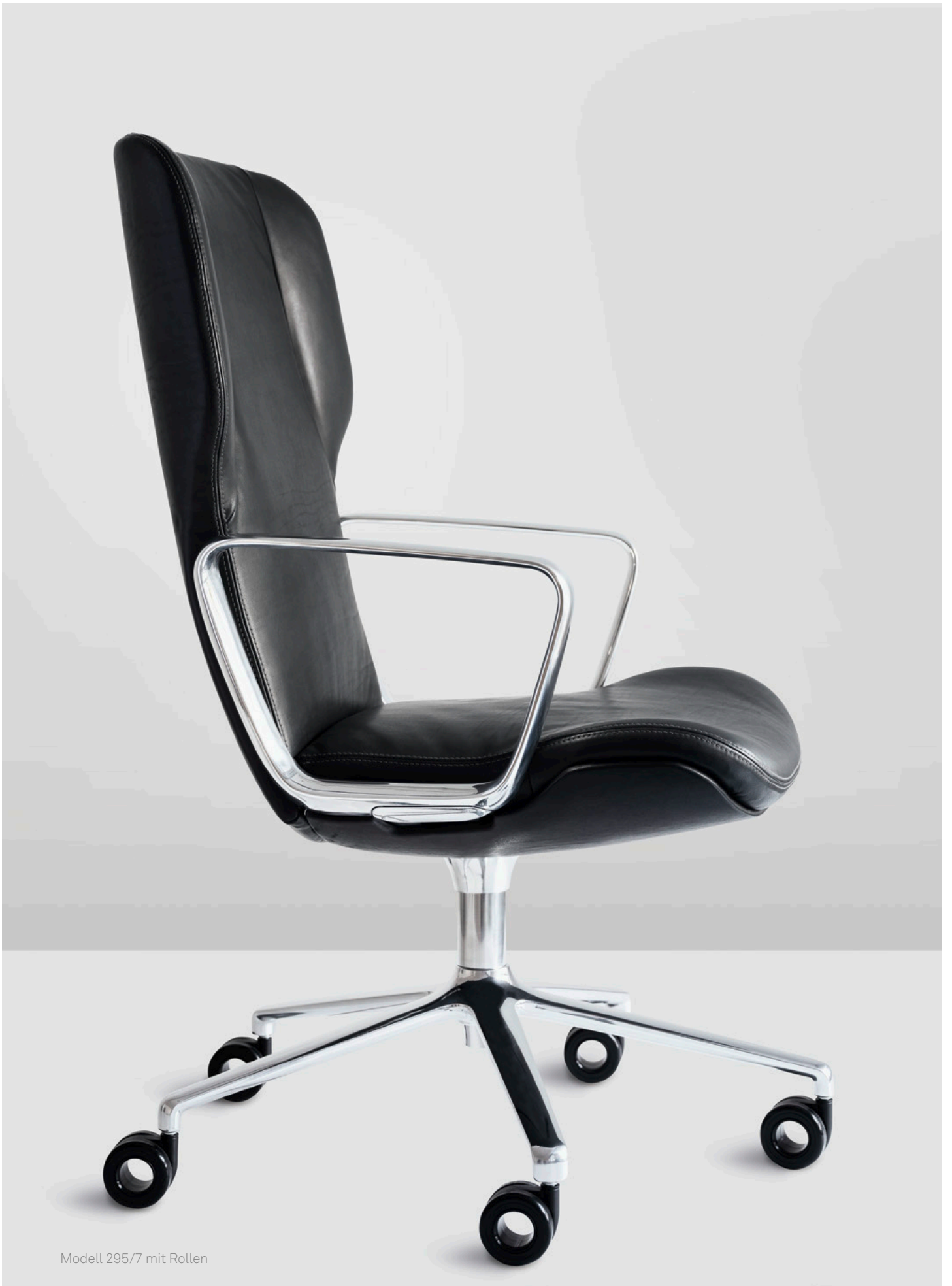
Modell 295/7 mit Rollen