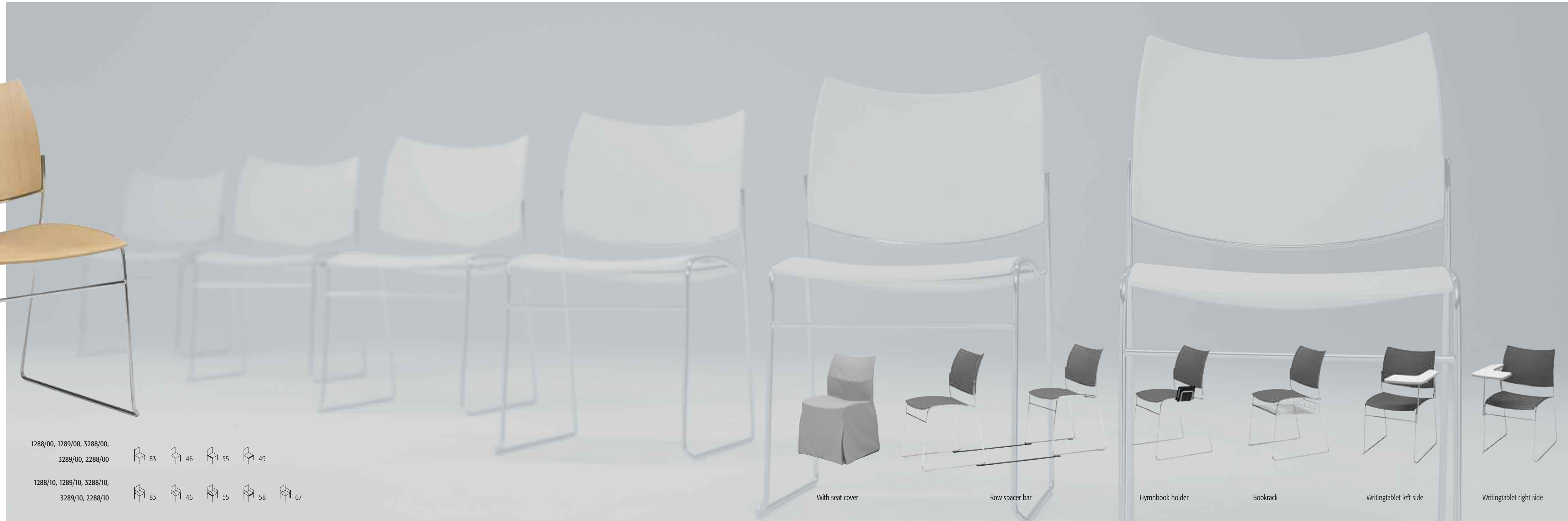
With seat cover