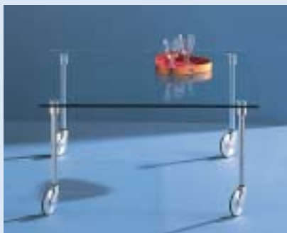
▲ STELLA 3F Couchtisch