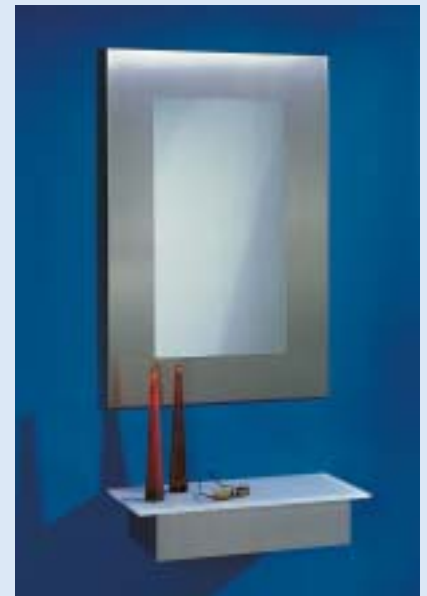
◀ ◀ ◀ STAR 2 Wandspiegel wall mirror B 50 T 1,5 H 147