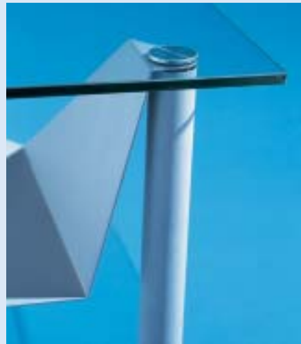
◀ RAPSODY Detail Videoeinsatz detail video-tray