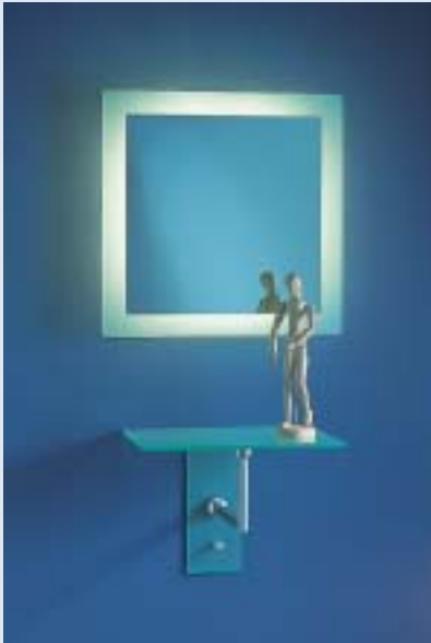
▲ ▲ STARLETT 2 Wandspiegel beleuchtet wall mirror illuminated B 50 T 10 H 50