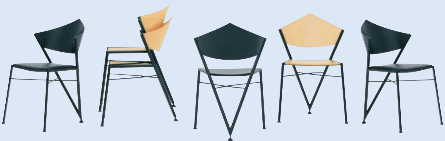
▲ VICTORY Stuhl Sitzhöhe 45 chair sitting height 45 B 54 T 60 H 85

Erfolgreiches Team aus einem Tisch und standfesten Dreibeinern mit ausgezeichnetem Sitzkomfort. Der Stuhl ist in verschiedenen Ausführungen erhältlich.