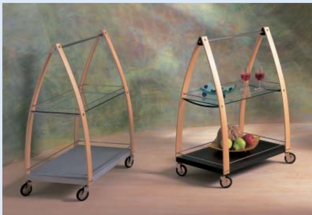
▲ RAPSODY 2 Rollwagen mit Hifi-/Videoeinsatz

sliding trolley with hifi-/video-tray B 72 T 52 H 44