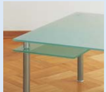
couch table with 2 slewing boards B 40 T 40 B 80 T 80 H 47