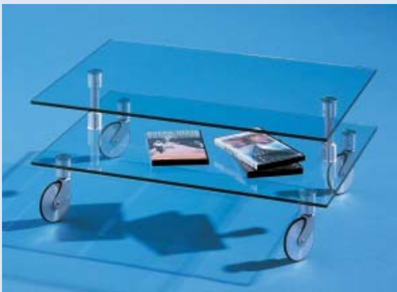
▲ TROLLEY TV Wagen tv trolley B 72 T 52 H 29