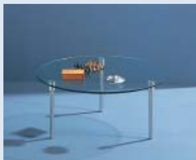
▲ STELLA 2B Couchtisch couch table Ø 70 H 31