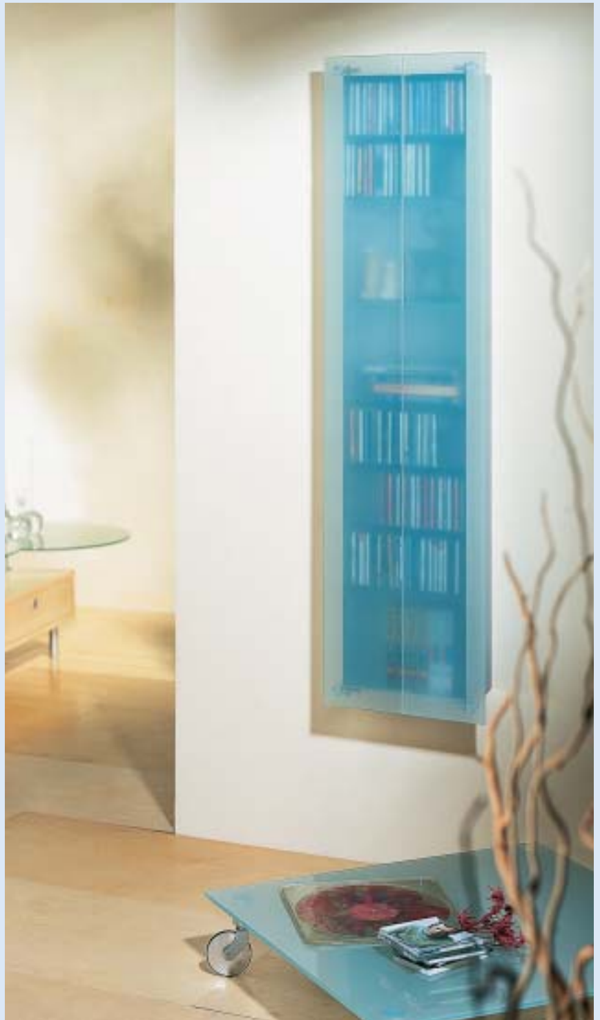
▲ SESAM 2 für 66 Videos oder 300 CD's for 66 videos or 300 cd's B 40 T 16 H 153

■ Design: Markus Börgens und D-TEC Design Team