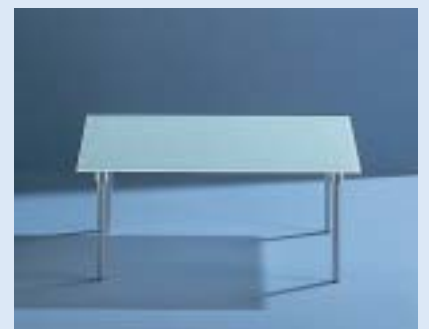
▲ STELLA 2E Beistelltisch side table B 72 T 52 H 31

■ Design: Markus Börgens und D-TEC Design Team