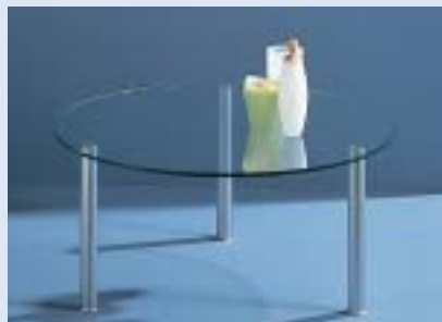
▲ STELLA 4C Couchtisch Ø 82 H 39