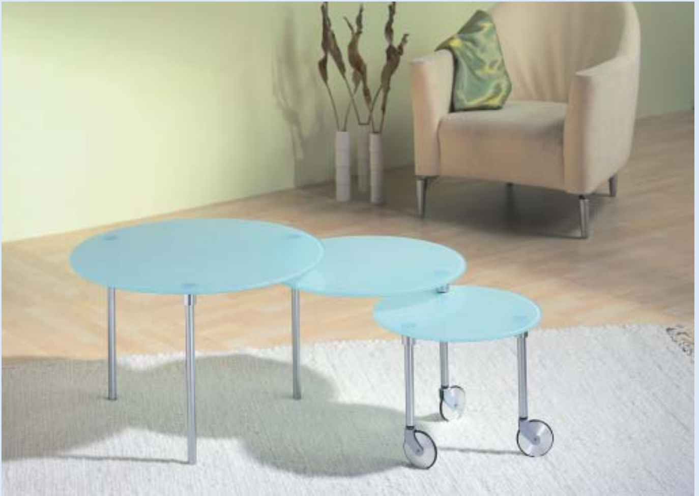
▲► ECLIPSE Couchtisch 3-fach ausdrehbar