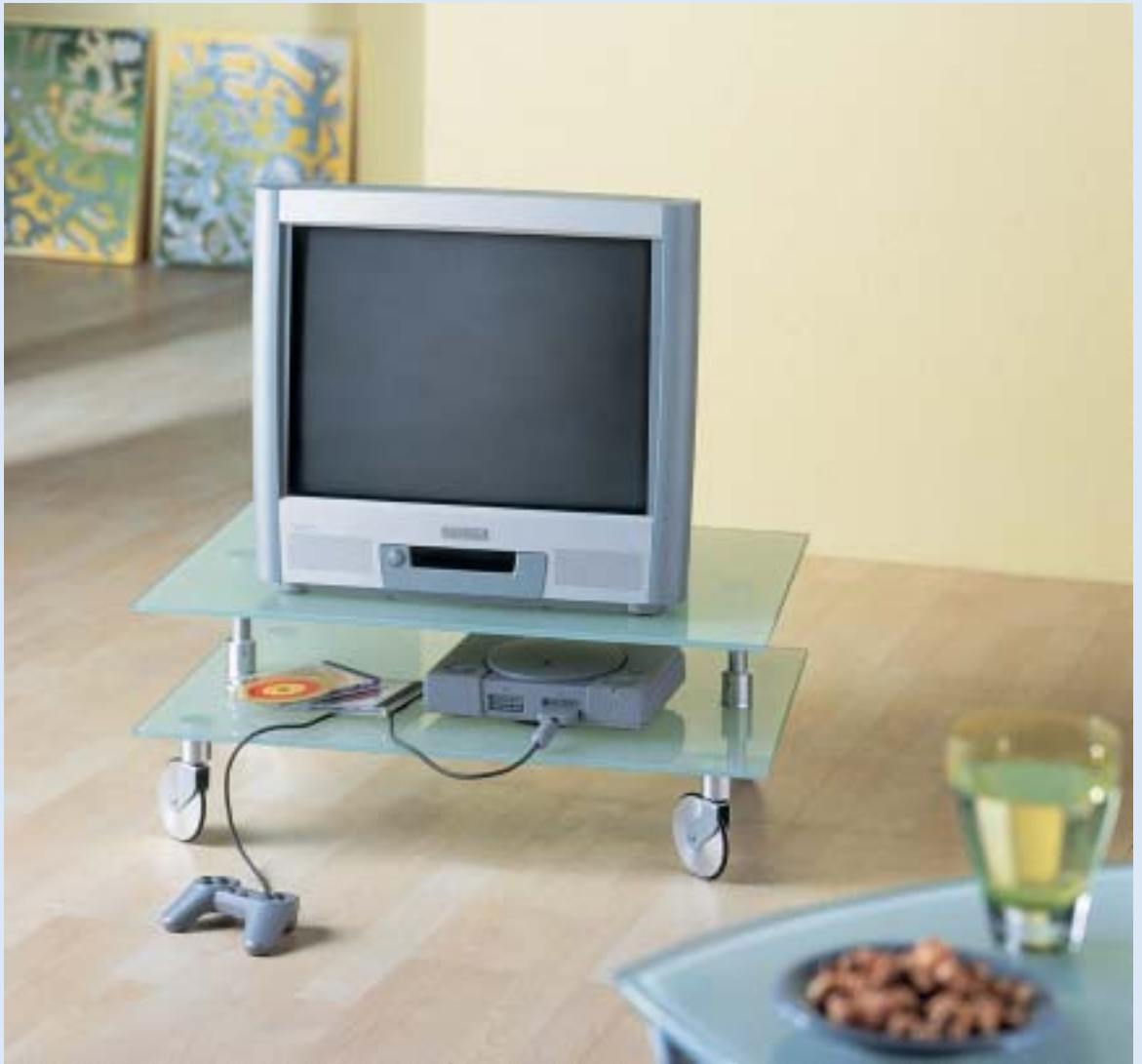
► TROLLEY TV-Wagen tv trolley B 72 T 52 H 29