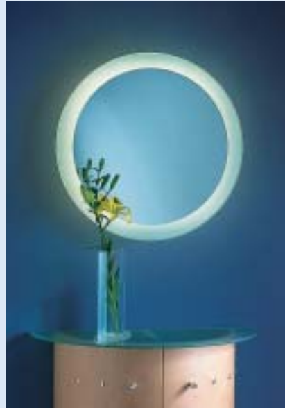
▲ ▲ STARLETT 1 Wandspiegel beleuchtet wall mirror illuminated Ø 60 T 10