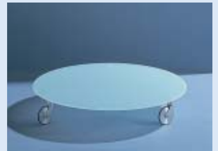
▲ STELLA 1C Rollwagen sliding trolley Ø 82 H 15

■ Design: Markus Börgens und D-TEC Design Team