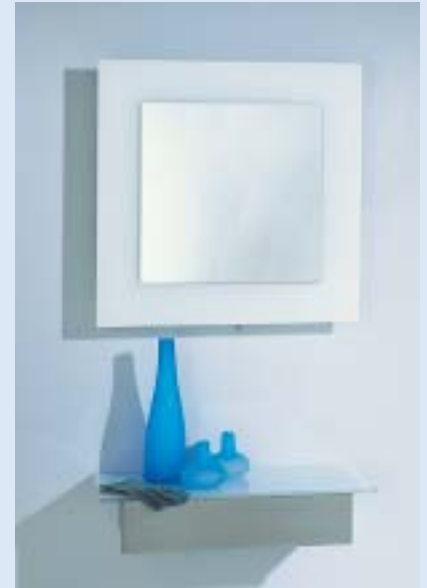
▲ ▲ STARLETT 5 Wandspiegel beleuchtet wall mirror illuminated B 60 T 10 H 60