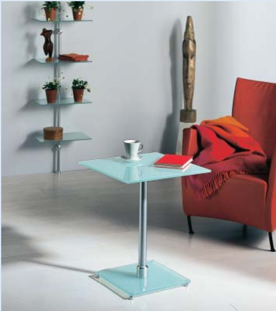
◀ ◀ LINEA 3 Wandregal wall shelf B 40 T 28 H 195