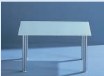
▲ STELLA 4E Beistelltisch B 72 T 52 H 39