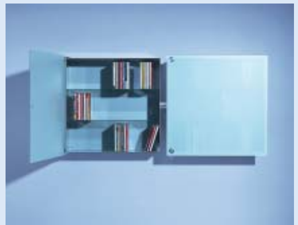
▲ ALIBABA 2 CD-Schränke für 240 CD's 2 cd cupboards for 240 cd's B 91 T 16 H 45