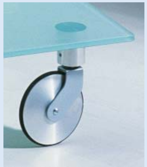
▲ TROLLEY Detail Aluminium Rolle detail aluminium wheel

■ Design: Markus Börgens und D-TEC Design Team