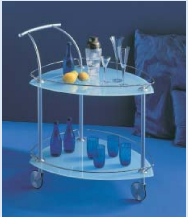
▲▲► TITANIC Servierwagen trolley B 53 T 79 H 85