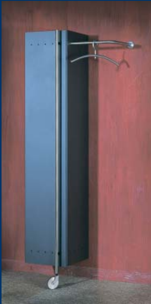
▲ TAO 1 Multifunktionales Ordnungsmöbel mit Garderobenstange multifunctional partitions complemented with wardrobe pole B 72 (offen/open 105) T 36 H 181