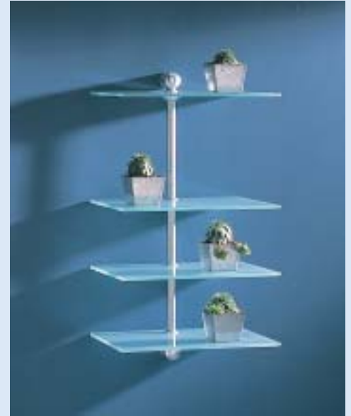
▲ LINEA 1 Regal mit 4 Böden