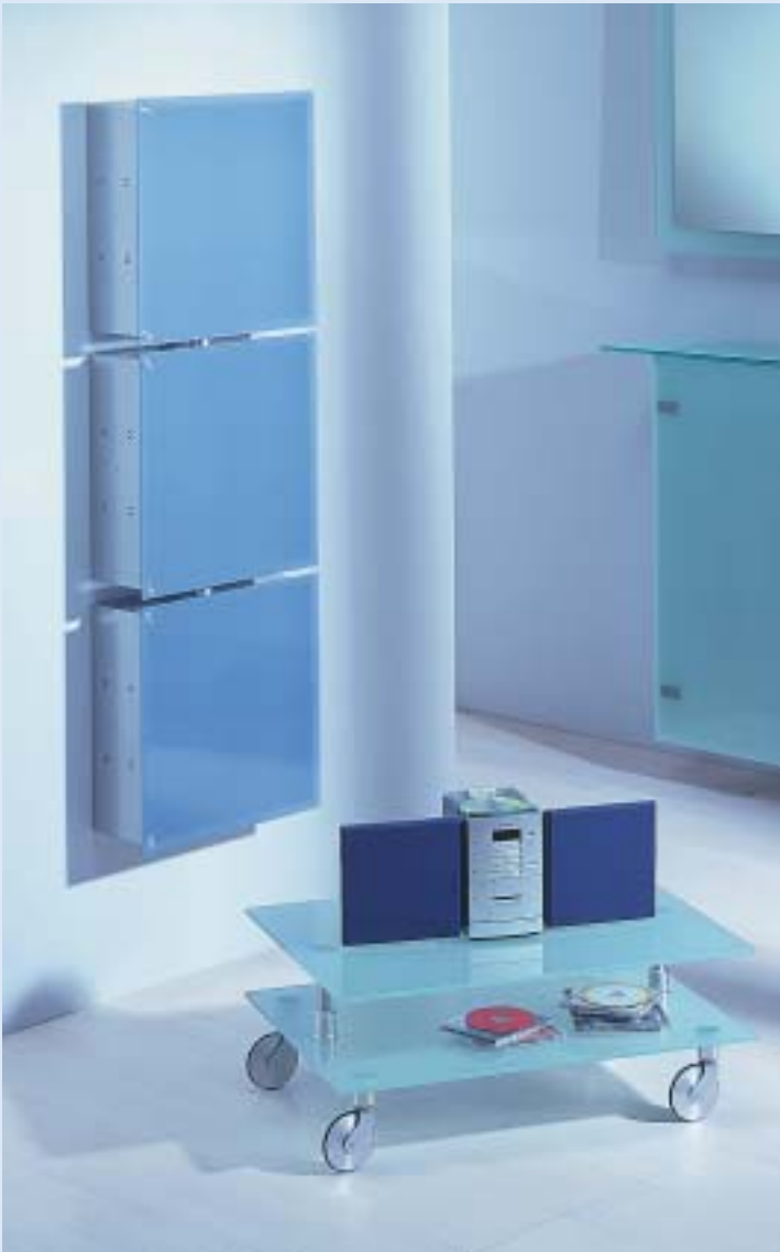
▲ ▲ ALIBABA 3 CD-Schränke für 360 CD's 3 cd cupboards for 360 cd's B 45 T 16 H 137