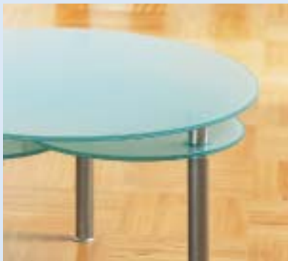
◀▲ TRINITY Couchtisch mit 3 schwenk- baren Ablagen Ø 44