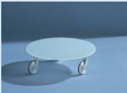
▲ STELLA 1A Rollwagen sliding trolley Ø 50 H 15