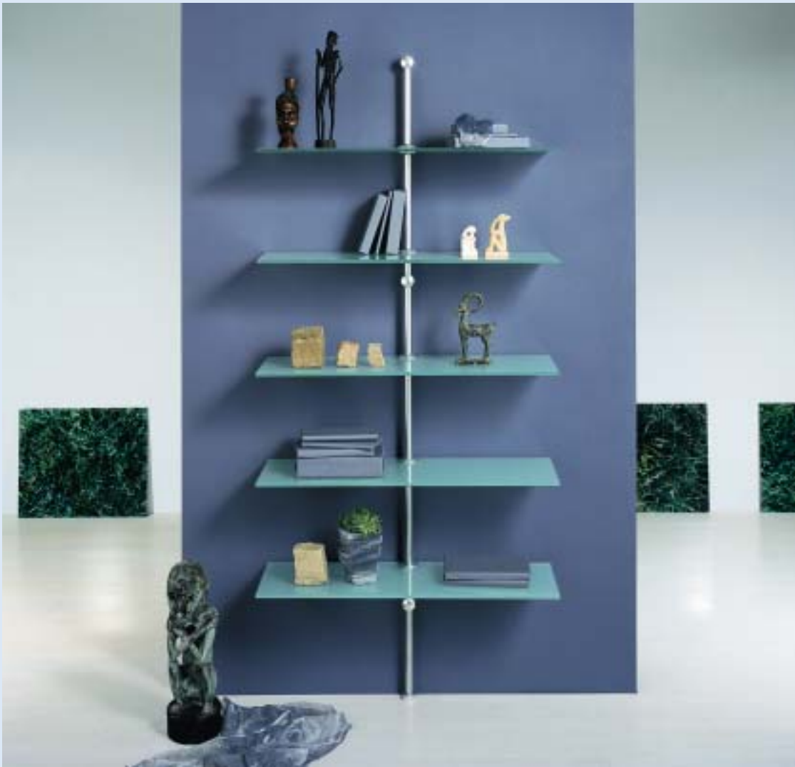
LIBRA Bücherregal mit stufenlos höhen- verstellbaren Böden aus Sicherheitsglas

book shelf with variable adjustable safety glass boards