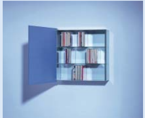
▲ ALIBABA CD-Schrank für 120 CD's cd cupboard for 120 cd's B 45 T 16 H 45