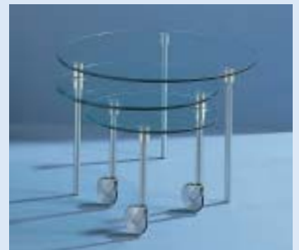
couch table 3-fold rotatable Ø 70/55/44 H 46/41/36