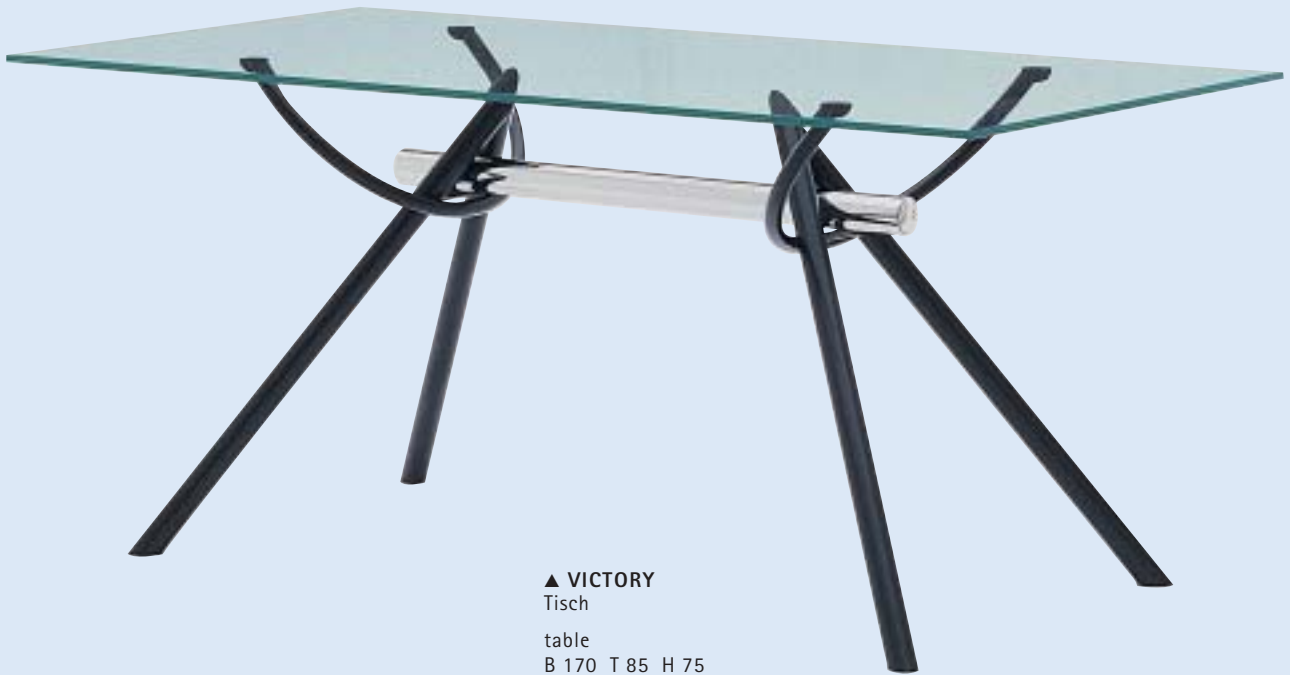
▲ VICTORY Tisch table B 170 T 85 H 75