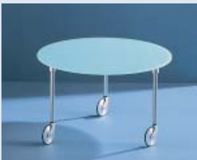
▲ STELLA 3C Couchtisch