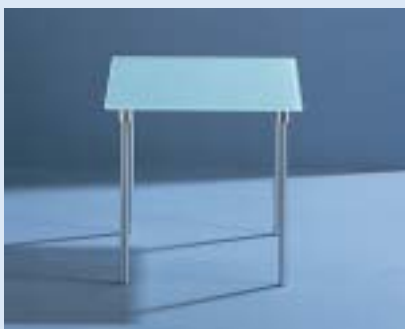
▲ STELLA 2D Beistelltisch side table B 50 T 50 H 46