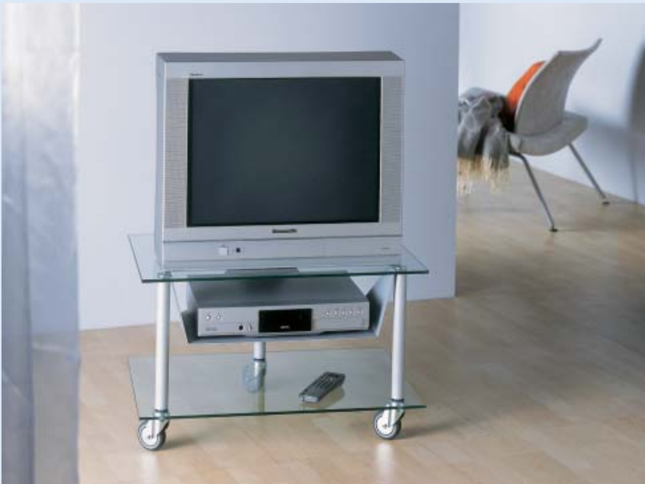
▼ RAPSODY 2 TV-Wagen tv trolley B 72 T 52 H 44