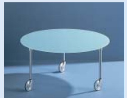
▲ STELLA 3B Couchtisch