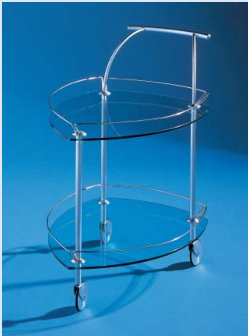
■ Design: Markus Börgens und D-TEC Design Team