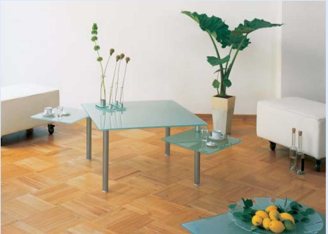
► ▲ QUADRA Couchtisch mit 2 schwenk- baren Ablagen B 40 T 40