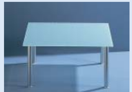
▲ STELLA 4F Couchtisch B 80 T 80 H 39

■ Design: Markus Börgens und D-TEC Design Team