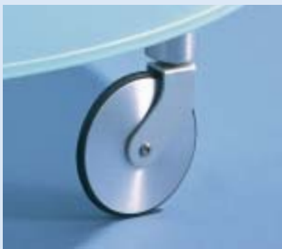
▲▲▲ STELLA 4C Couchtisch couch table Ø 82 H 39