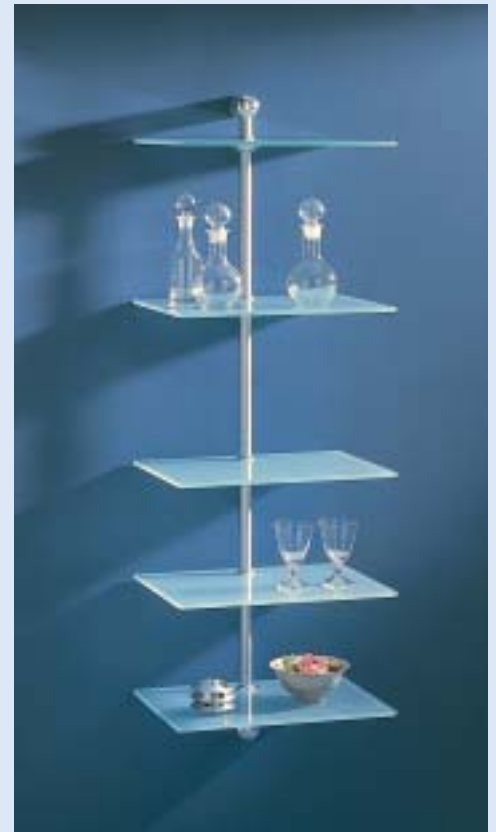
▲ LINEA 2 Regal mit 5 Böden