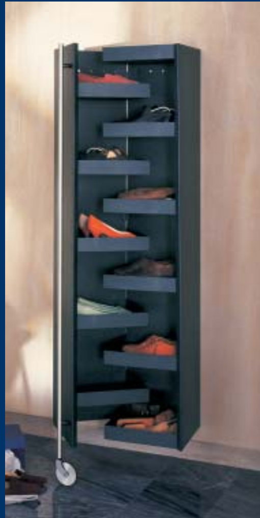
▲ TAO 1 Multifunktionales Ordnungsmöbel multifunctional partitions B 36 (offen/open 72) T 36 H 181