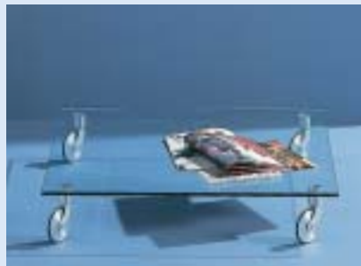
▲ STELLA 1F Rollwagen sliding trolley B 80 T 80 H 15