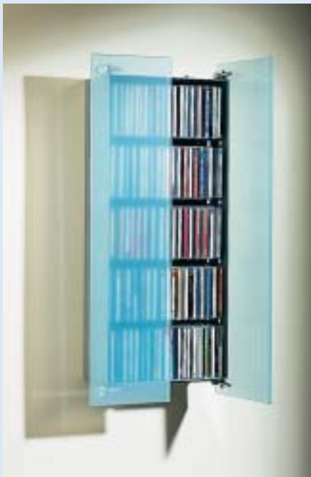
▲ SESAM 1 für 33 Videos oder 150 CD's for 33 videos or 150 cd's B 40 T 16 H 81

video- or cd-cupboard with glass doors and adjustable glass plates