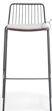
3657.3 EN: Optional cushion for items 3657 - 3658 IT: Cuscino opzionale per articoli 3657 - 3658