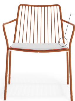
3659.3 EN: Optional cushion for item 3659 IT: Cuscino opzionale per articolo 3659