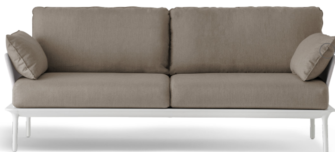
3005 EN: Optional side pillow IT: Cuscino laterale opzionale

EN: Sofa with slim perimeter frame in extruded aluminium supported by four die-cast aluminium legs. Cushions in polyurethane foam covered in waterproof fabric