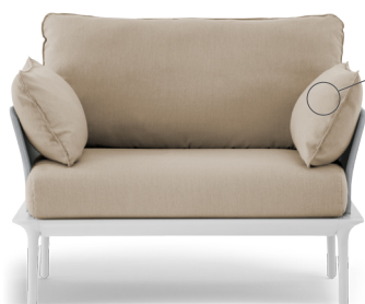
3005 EN: Optional side pillow IT: Cuscino laterale opzionale

EN: Lounge armchair with thin perimeter frame in extruded aluminium supported by four die-cast aluminium legs. Cushions in polyurethane foam covered in waterproof fabric